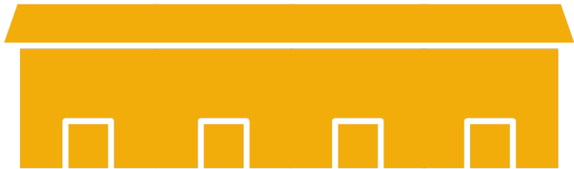
A) KAIKKIIN HUONEISTOIHIN

Ulkokautta tuotu valokuitu voidaan toteuttaa koko talon ratkaisuna kaikkiin huoneistoihin tai yksittäisiin huoneistoihin. ElmoNet mitoittaa rakennettavan kuituverkon siten, että siihen voidaan lisätä huoneistoja myös myöhemmässä vaiheessa.