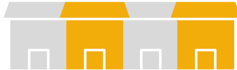
B) YKSITTÄISIIN HUONEISTOIHIN